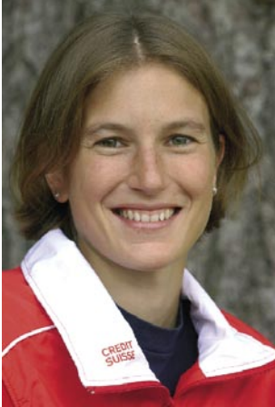
Simone Niggli-Luder Campionessa mondiale ai Giochi olimpici Sportiva svizzera dell'anno 2003

Sin da bambina, la foresta era uno dei posti più incantevoli per i miei giochi. Ancora oggi, dopo anni, trascorro ore e giornate del mio tempo preferibilmente all'aria aperta, sia allenandomi sia nelle competizioni sportive.